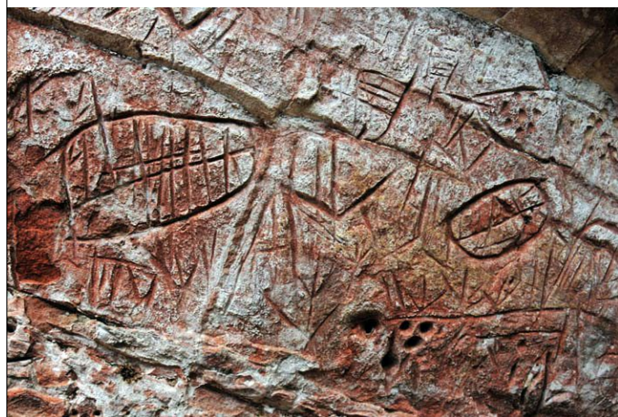
Arte rupestre en Ita Letra