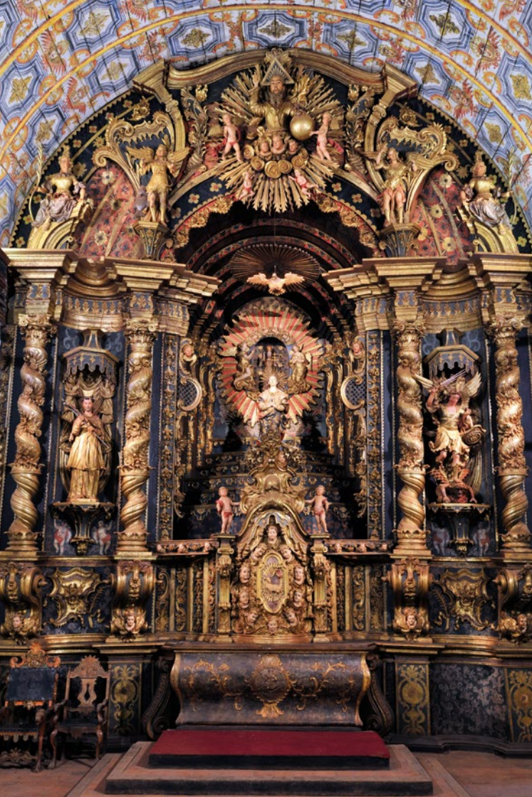
Arte barroco en Yaguairón