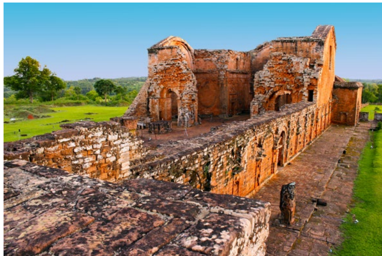
Ruinas jesuítico-guaraníes del periodo colonial

Cita recomendada: Paraguay, Secretaría de Emergencia Nacional (SEN), "Manual de la Reunión", Primera Reunión Ministerial y de Autoridades de Alto Nivel sobre la Implementación del Marco de Sendai para la Reducción del Riesgo de Desastres 2015-2030 en las Américas, 8 y 9 de junio de 2016, Asunción.