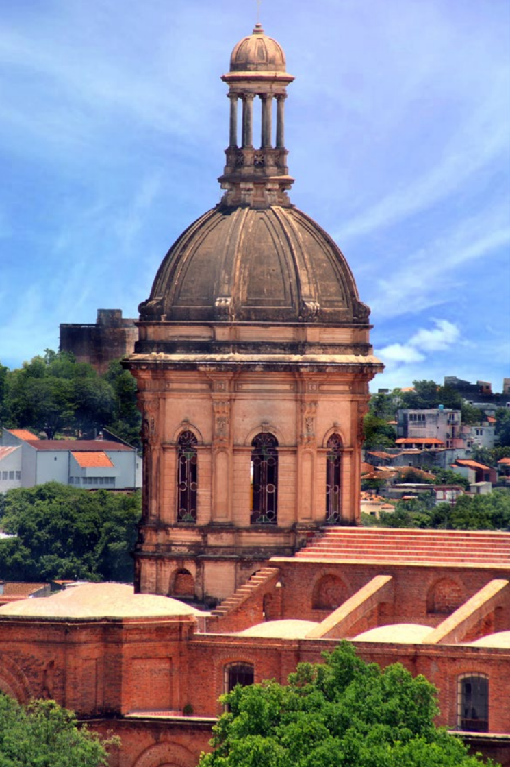
Cúpula de "La Encarnación"