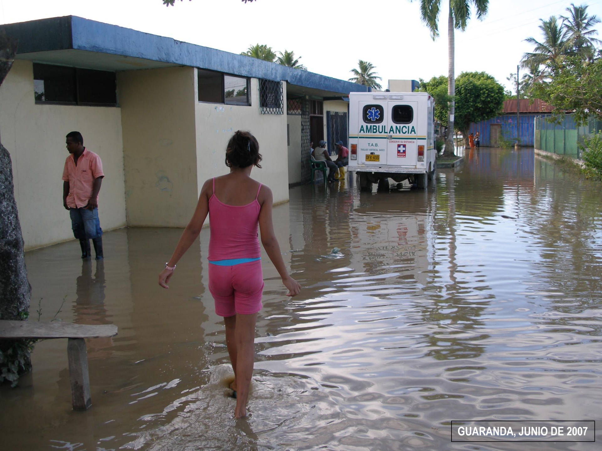
GUARANDA, JUNIO DE 2007