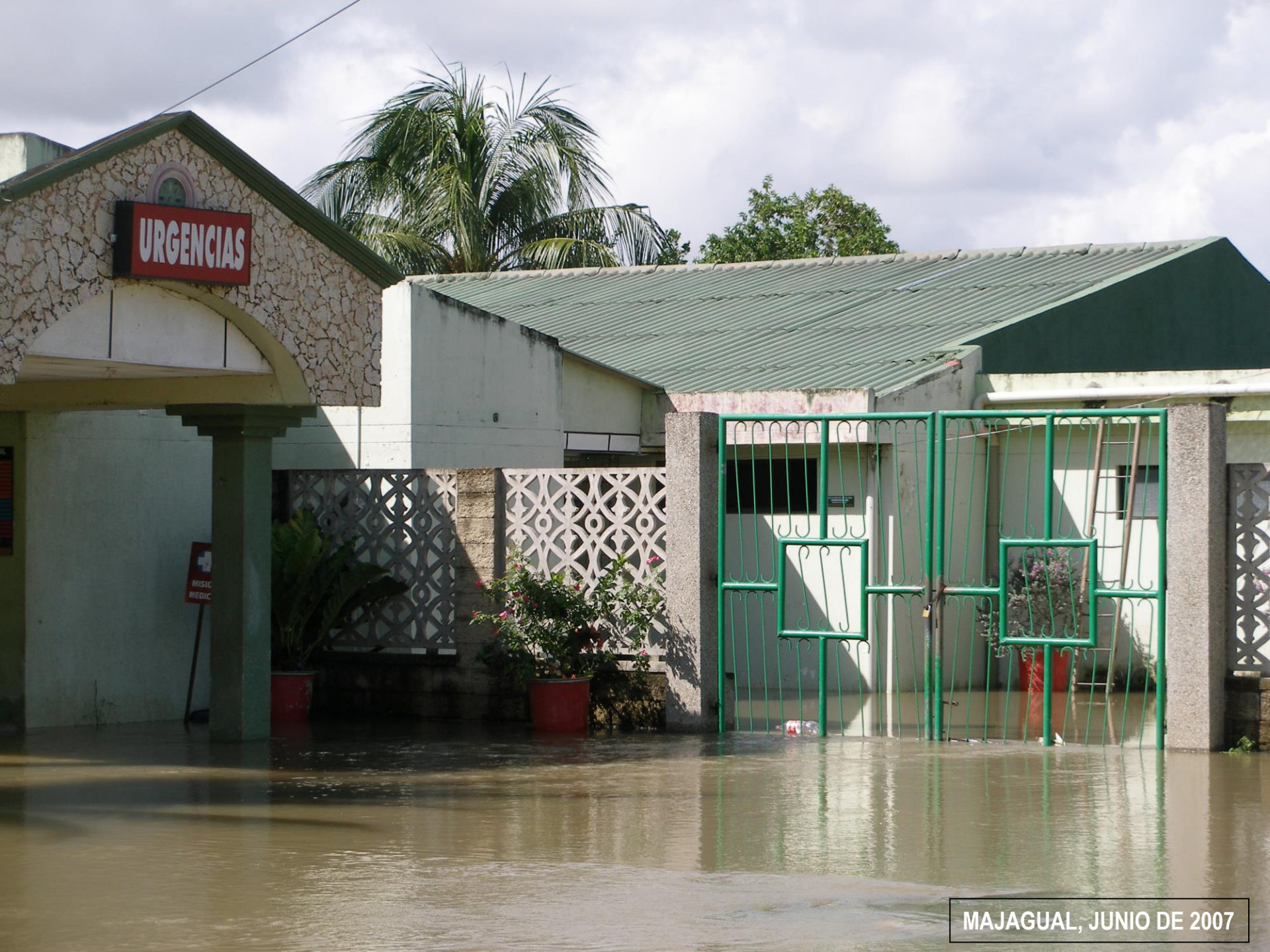
MAJAGUAL, JUNIO DE 2007